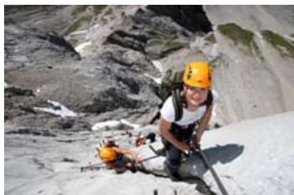
Der Johann - Einer der schönsten Klettersteige der Alpen